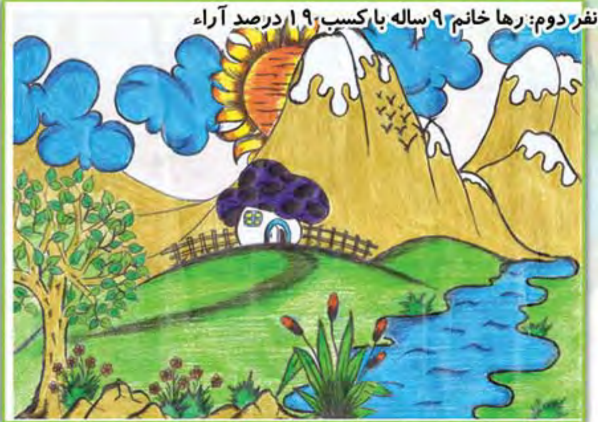
نفر دوم: رها خانم ۹ ساله با کسب ۱۹ درصد آراء