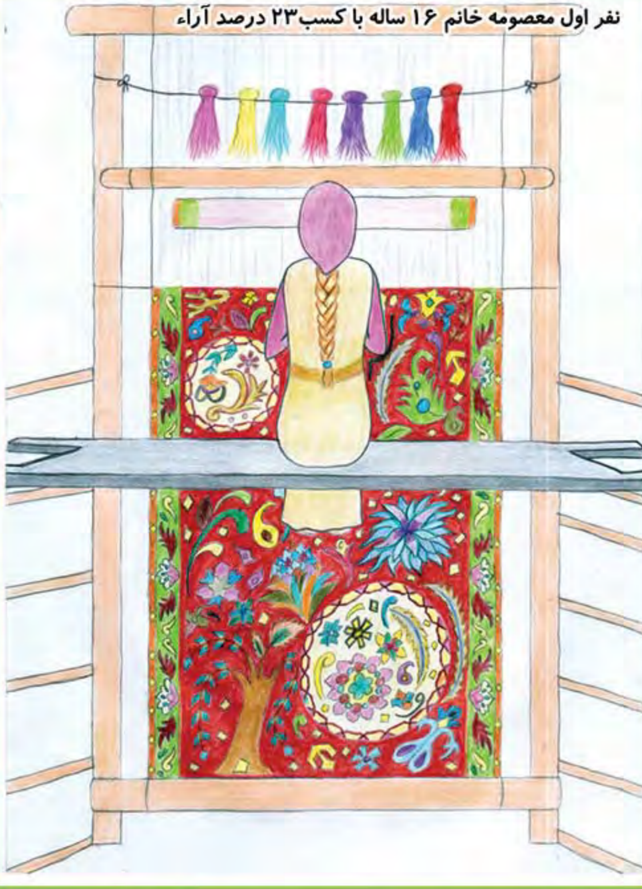
نفر اول معصومه خانم ۱۶ ساله با کسب ۲۳ درصد آراء